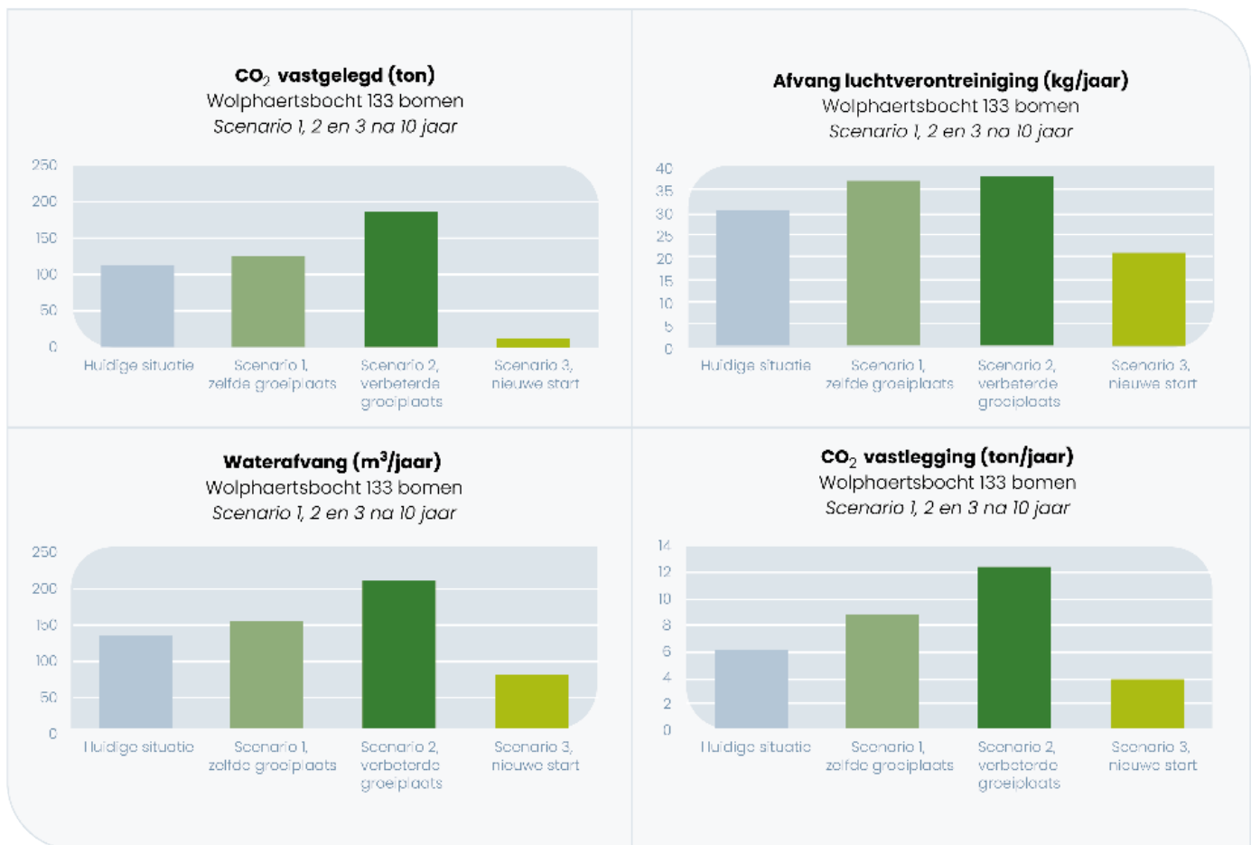
Grafiek 1: Ecosysteemdiensten geleverd door de bomen langs de Wolphaertsbocht.