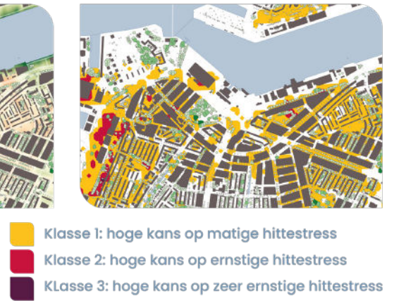
Afbeelding 1. Oppervlaktetemperatuur zonder (links) en met (midden) de boomkronen uit de BomenMonitor. Rechts: de vlakkenkaart die het risicogebied aangeeft voor het ontwikkelen van stress bij bomen.

vocht beschikbaar in de bodem? Dan stopt de boom met functioneren en levert hij minder baten.