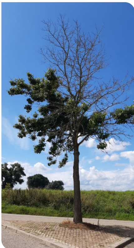
Afbeelding 2: Voorbeeld van een gestreste boom met als oorzaak een slechte groeiplaats

Bij hoge temperaturen moet een boom zichzelf kunnen verkoelen. Dit gebeurt door verdamping van water via de bladeren. De boom op de foto kan niet goed in zijn eigen waterbehoefte voorzien. De boomspiegel is te klein en de bodem waarschijnlijk te verdicht. Regenwater kan daardoor niet goed doordringen in de bodem. De verstening rond de boom zorgt ervoor dat de warmte teruggekaatst en de temperatuur rond de boom nog hoger wordt. Een goede groeiplaats is dus zeer