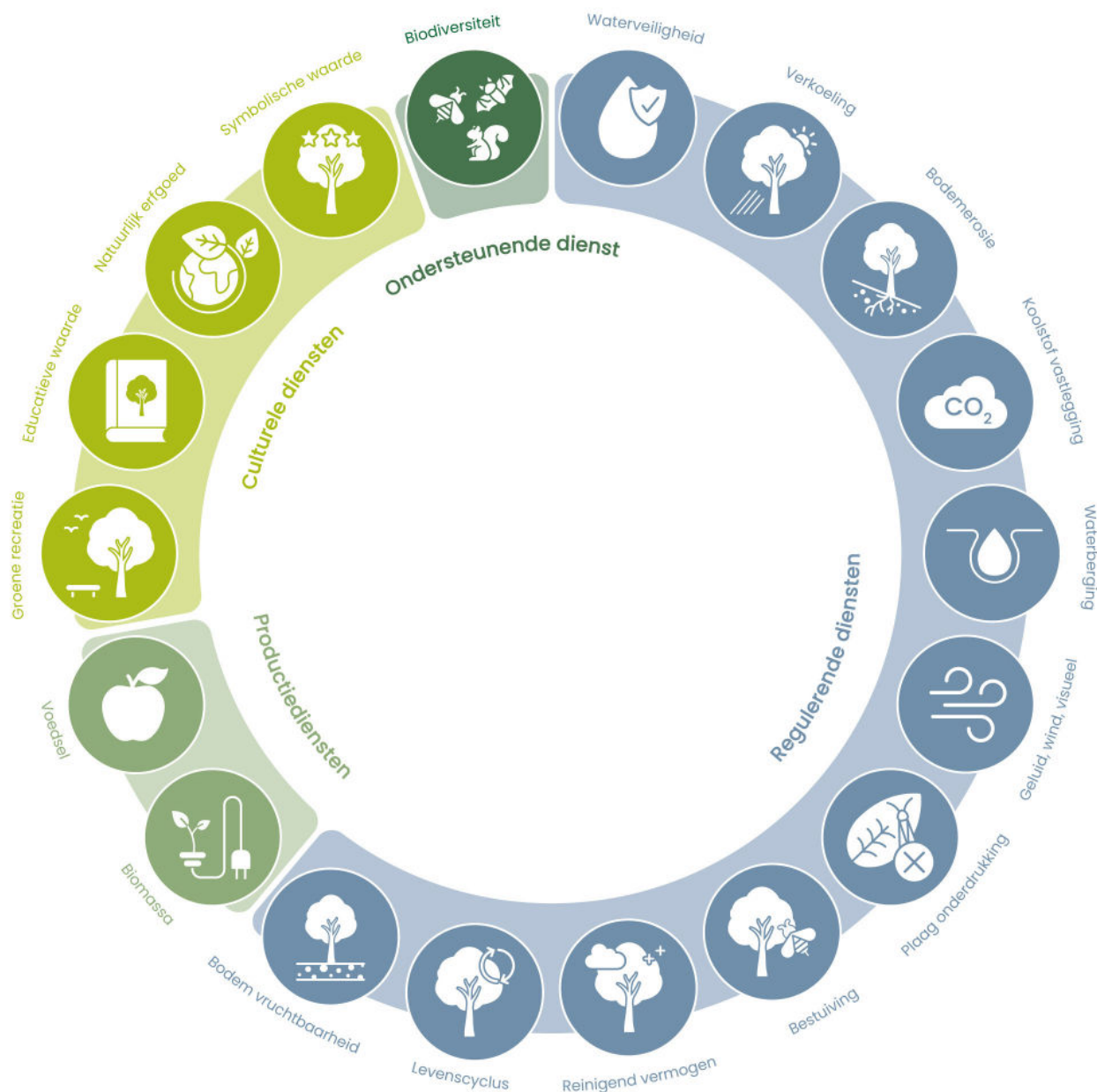
Figuur 1. De ecosysteemdiensten die door het RIVM in kaart zijn gebracht

belangrijk om de risico's op hitte- en droogtestress te verlagen. Een afdoende vochtvoorziening is een voorwaarde voor het goed functioneren van een boom.